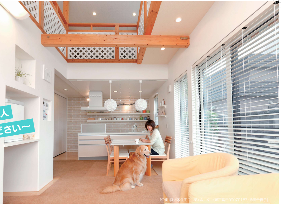
「企画:愛犬家住宅コーディネーター(認定番号09070187)池田千夏子」