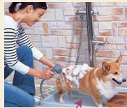
勝手口にペット用水洗があると お散歩後の足洗いにも便利です