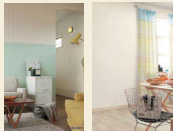
消臭系クロス サンゲツ 「ルームエアアー」(右) リリカラ 「消臭エアリフレ」(左)